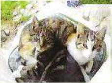
Katzen „Johanna und Sibille“ Tauben Pfau